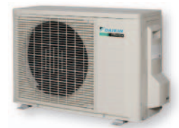
Наружный блок RXS20,25,35,42G